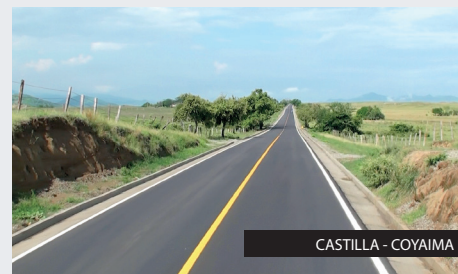
CASTILLA - COYAIMA

Consolidarnos al año 2017 dentro de las 35 primeras y mejores compañías de Ingeniería Civil en Colombia, participando en macroproyectos, concesiones y en alianzas con empresas nacionales y desarrollar nuevos productos que contribuyan con el progreso económico y social de las regiones.