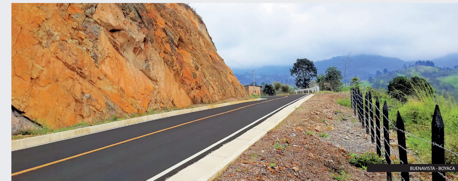
BUENAVISTA - BOYACA