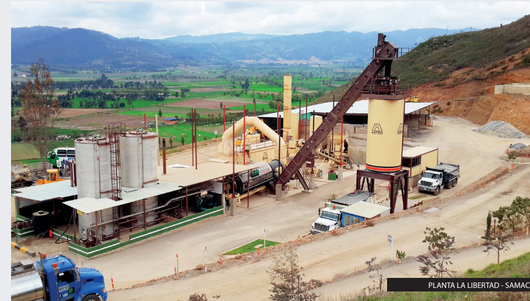
PLANTA LA LIBERTAD - SAMACA

Galindez (Cauca) Olaya Herrera (Tolima) Las Señoritas (Tolima) Barragán (Tolima) Araujo (Santander) Guarino (Caldas) Coscorron (Santander) Martin (Nariño) La Libertad (Boyaca) Los Cocos (Cundinamarca)