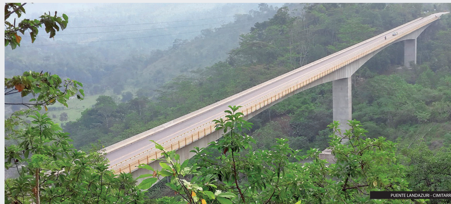
PUENTE LANDAZURI - CIMITARRA